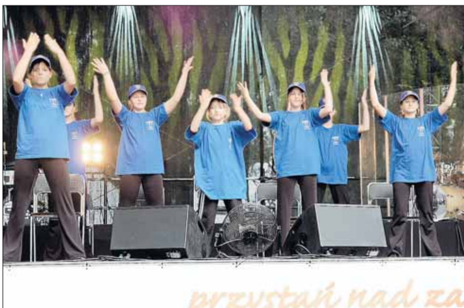
Występ zespołu Staśki