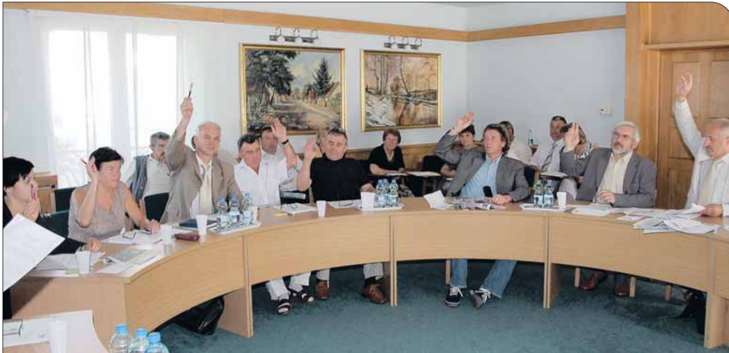
Głosowanie w sprawie przebiegu trasy „Via Baltica”

W dniu 2 czerwca 2008 r. w sali konferencyjnej Urzędu Gminy Nieporęt odbyła się XXII nadzwyczajna sesja Rady Gminy Nieporęt, której tematem był planowany przebieg Europejskiego Korytarza Transportowego „Via Baltica” (Warszawa – Budzisko).