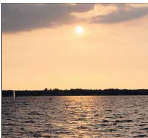
Zalew urzekal urodzą...