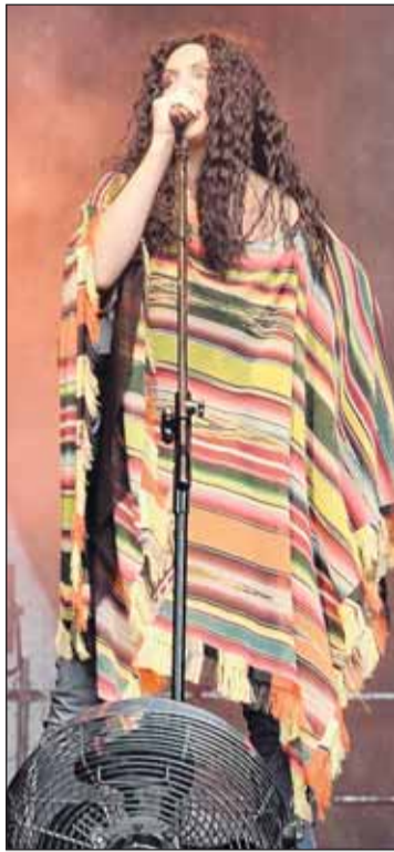
Gwiazda wieczoru - Kayah