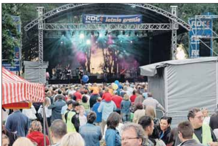
Święto Gminy Nieporęt