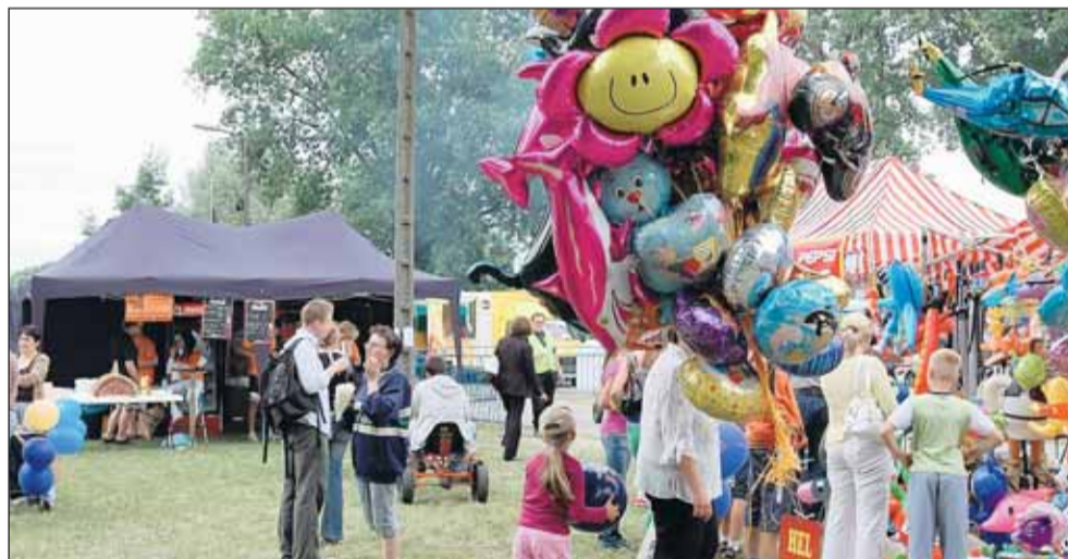
Kolorowe stoiska na festynie