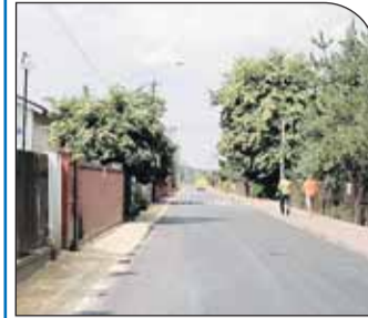
Nowa nakładka asfaltowa na ulicy Przyrodniczej w Michałowie-Grabinie

Dobiegły końca prace przy budowie kolejnych gminnych dróg i chodników.