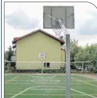
Nowe boisko w Beniaminowie

W Beniaminowie, przy budynku filii Gminnego Ośrodka Kultury, powstało boisko do piłki siatkowej i koszykówki. Mieszkańcy i goście miejscowości, korzystający z oferty kulturalnej Ośrodka, mają teraz jeszcze więcej możliwości aktywnego spędzenia czasu wolnego.