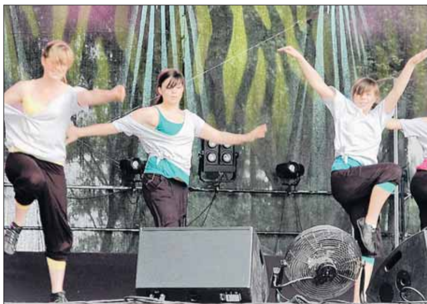
Tańczy zespół ze Stanisławowa Drugiego