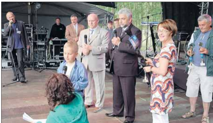
Wręczenie nagród laureatom konkursu wędkarskiego