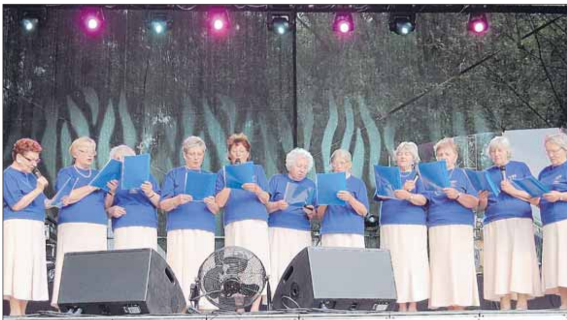
Występ zespołu Zegrzynianki