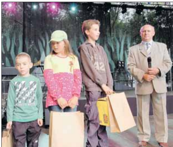
Laureaci gminnego konkursu na maskotkę