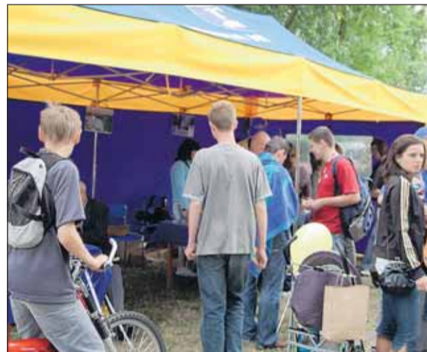
Namiat Urzędu Gminy Nieporęt