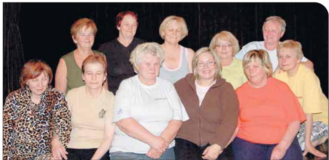
Uczestniczki zajęć propagujących zdrowy styl życia

Nie wszyscy mieszkańcy wiedzą, że na terenie gminy prowadzone są zajęcia propagujące ZDROWY STYL ŻYCIA.