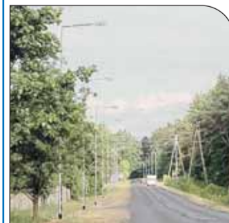
Oświetlenie ulicy Wojska Polskiego w Białobrzegach

Zakończona została budowa oświetlenia ulicy Wojska Polskiego w Białobrzegach, na odcinku od ronda, wzdłuż Osiedla Wojskowego. Zainstalowane zostały 22 słupy z wysięgnikiem jednoramiennym oraz jeden słup dwuramienny, który oświetla petlę autobusową. Długość linii kablowej wyniosła 768 metrów. Wykonawcą było Przedsiębiorstwo Instalacji Elektrycznych z Łomży, koszt prac wyniósł ok. 70 tys. zł.