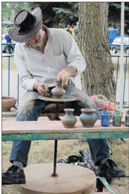
Wieści święci garnki lepią