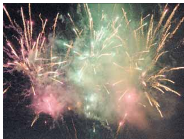
Pokaz ogni sztucznych