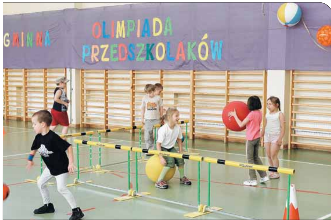
Trzecia Gminna Olimpiada Przedszkolaków

W poniedziałek (16.06) Szkoła Podstawowa w Wólce Radzywińskiej stała się areną sportowych zmagania sześciolatków z gminnych placówek oświatowych. W trzeciej Gminnej Olimpiadzie wzięło udział około 120 przedszkolaków.