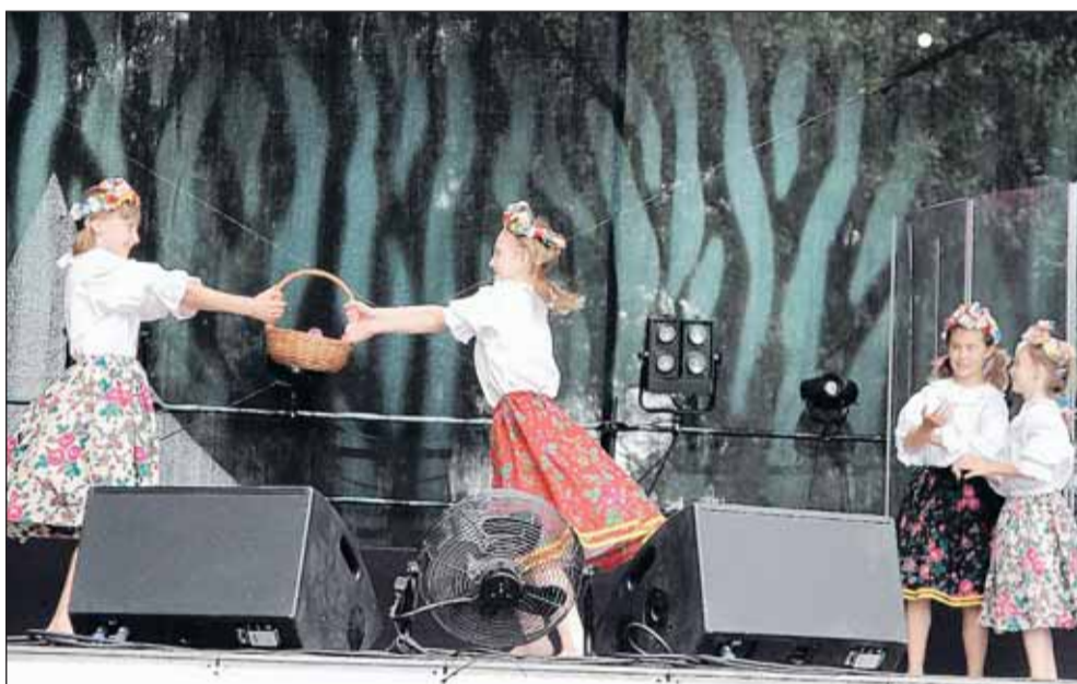
Taniec ludowy „Koszyczek” wykonuje zespół folklorystyczny z GOK